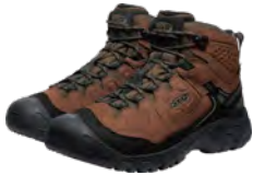
KEEN TARGHEE IV MID WP (ターキー フォーミッドウォータープルーフ) 環境配慮した素材と製法を採用したレザー素材の防水トレイルシューズ。登山初心者から上級者まで幅広く対応。

初めての山登りにはとくに不要なものを持参しがちです。経験を重ね、目的の山の自然条件やコース状況などを計画