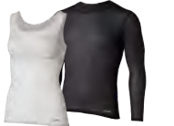
ファイントラック ドライレイヤー ベーシック ロングスリーブ・プラタンク 肌に直接着て、吸汗速乾ウェアとの重ね着で、肌をドライに保ち、汗冷えのリスクを軽減し、山での安全・快適性を高めます。

● アンダーウェア …夏山では高い吸湿拡散性や速乾性に重点を置き、春、秋、冬の寒冷期には加えて高い防寒性を持つ、高機能ケミカル素材を使ったもので(ウール素材も可)、季節と気温に応じて半袖・長袖を使い分けます。汗冷え軽減を目的とした撥水効果を持つものもあります。