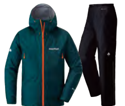
モンベル ストームクルーザー ジャケット&パンツ 卓越した防水性・透湿性、そして軽量性。全てを備えた究極のレインウェアです。

● アウターウェア …行動中の雨と風や雪などから衣服内を守る一枚地の全天候型ジャケット&パンツなど。ダウンジャケットもそうですが、行動中の防寒性はアンダーウェア~中間着①・②に任せて、防風性と透湿防水性を重視します。冬の低山ぐらいまでなら、レインウェア上下の兼用もよいでしょう。