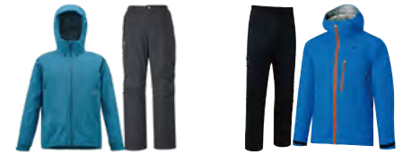
ミレー ティフォン 50000 ストレッチ ジャケット&パンツ ミレー独自の防水透湿素材が、シルクタッチの肌触りとしなやかで快適な着心地を提供する、ムレにくい防水ウェア。 ファイントラック エバーブレス フォトン ジャケット&パンツ 快適な着心地とストレッチ性にこだわり防水透湿素材を開発。ストレスフリーの動きやすさと軽さを両立しました。

アプローチや里山・山麓ウォーキングなどでは折り畳み傘の使用も可能ですが、それ以上高い山では、上下セパレートのレインウェアがベストです。高い防水性のほかに、内部のムレを逃がす透湿防水素材やメッシュ・ライニングを使ったものがおすすめです。冬の低山ぐらいまでなら全天候型ジャケット&パンツとして兼用できるように防風性も重視しましょう。