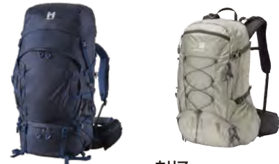
ミレー サース フェー NX 75+ 蒸れや冷えを防ぐ背面構造と、雨を弾く撥水加工でドライが持続する、ミレーが誇るテント泊用大型バックパック。 カリマー contour 27(コントア 27) 背負ったままでも背面長の調整可能なサイズアジャストシステムを搭載し、幅広いユーザーに対応可能。

容量(リットル)と形から大きく分けて、小容量で、フロント・パネルの開閉によって荷を出し入れするデイパック・タイプ(20~30ℓ前後)と、中~大容量(35~60ℓ以上)で、上部雨蓋を開けて荷を出し入れするアタックザックタイプがあります。