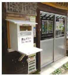
登山口では、登山計画書または登山届を提出しましょう。

登山計画は提出するものとの認識が普通でしたが、「共有」という考え方も普及し始めました。つまり、友人、家族など大切な人と登山計画を共有することで安全・安心をより高く求めるといことです。