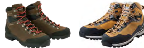
モンベル アルパインクルーザー 800 レザー Men's 荷物の重い長期縦走や積雪量の少ない冬季トレッキングに適した全天候型レザーアーツです。 グランドキング GK88 無雪期縦走登山に適した抜群の高機能性を誇る、軽量で日本人の足型にフィットする歩きやすいトレッキングシューズです。

つま先がやや反りアッパーもソフトです。日本全国、多くの一般登山コースの日帰りから1泊2日程度の登山に適しています。