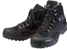
キャラバン C1_025 初心者はもちろんのことベテラン登山愛好家まで、老若男女・年齢を問わず幅広い層に愛される軽登山靴の代表モデルです。

②は森林限界を超えず、6時間以上の登山に使うために作られており、踵部のコバはありません。荷物も増えてきますが、ソールもそれほど固くなく、