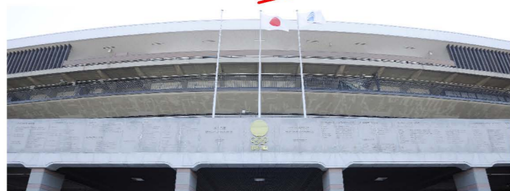
記念碑9 【東京オリンピック大会優勝者銘盤】 H:2m W:54m