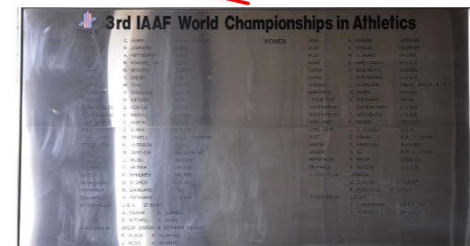
記念碑11 【1991年第3回世界陸上競技選手権大会優勝者銘盤】 H:2.76m W:5.14m