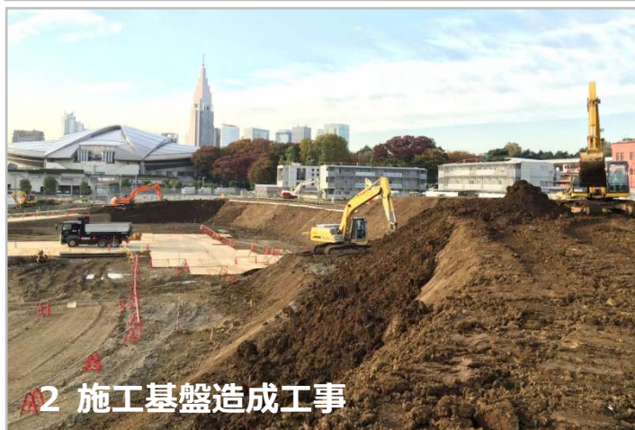
2 施工基盤造成工事