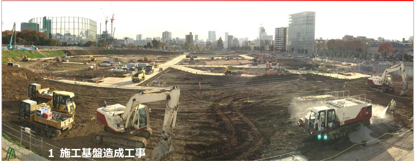
1 施工基盤造成工事