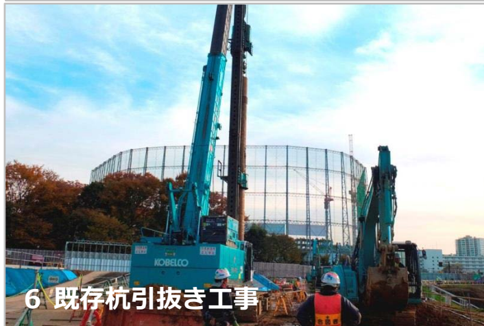
6 既存杭引抜き工事