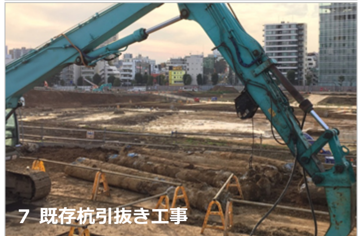
7 既存杭引抜き工事