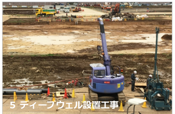
5 ディープウェル設置工事