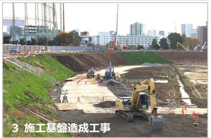
3 施工基盤造成工事