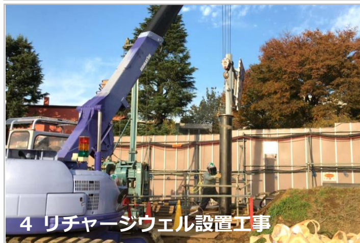
4 リチャージウェル設置工事