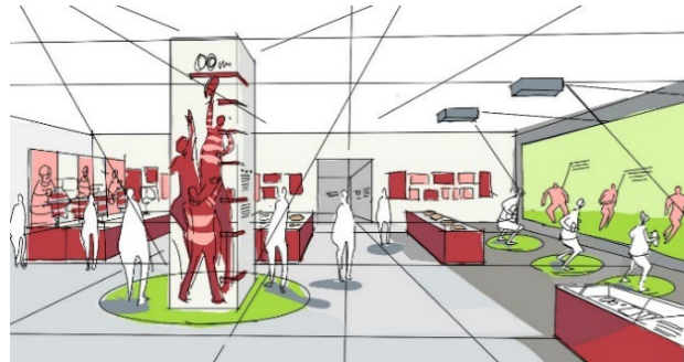
オープンギャラリー空間活用イメージ

話題性のあるスポーツピックのタイムリーな展示、ワークショップやイベント、レセプションの開催、また学校団体の集合スペースとしての活用等、柔軟に運用して集客を図ります。