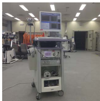
写真 2. エアロモニタ AE-310S (ミナト医科学社製)