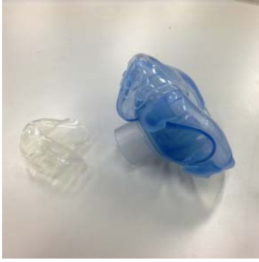
写真3. SENSE SEAL™ (ハンスドルフ社製)