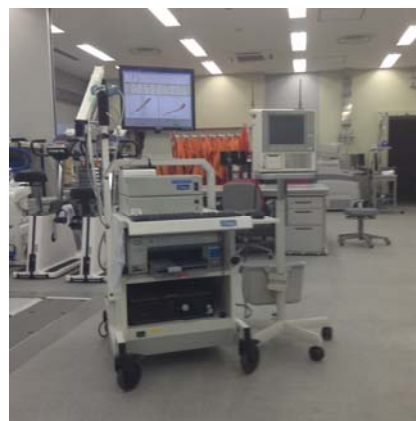
写真 1. V_{max}S229 (SensorMedics 社製)

イ・ブレス法と呼気採集法の選択が可能であるが、JISS では呼気採集法により測定を行っている。また、Polar 社製のハートレートモニターとの通信を可能にする心拍受信ユニットを接続して、測定中の心拍数を同期させている。