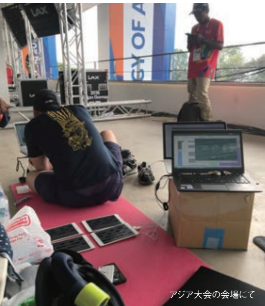
アジア大会の会場にて

昨年夏、インドネシアのジャカルタで開催された第18回アジア競技大会において、競泳日本代表チームは全競技の総合国別メダル