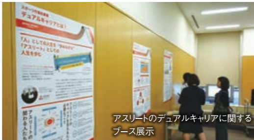
アスリートのデュアルキャリアに関するブース展示