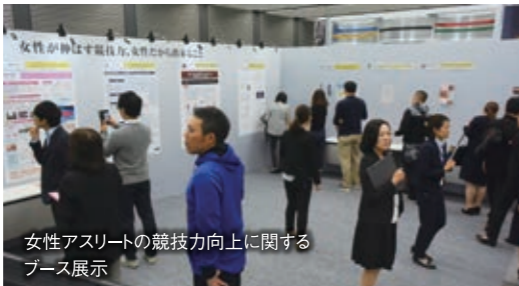
女性アスリートの競技力向上に関するブース展示