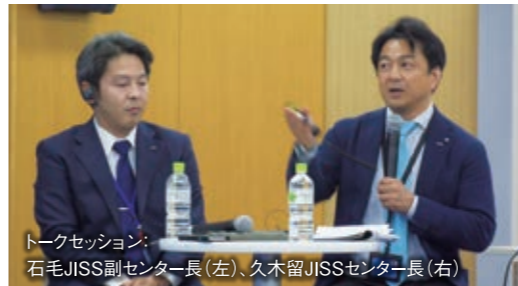
トークセッション：石毛JISS副センター長（左）、久木留JISSセンター長（右）