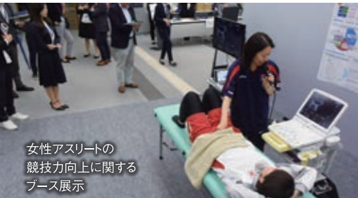
女性アスリートの競技力向上に関するブース展示