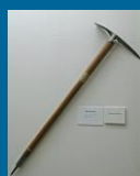
ピッケル (秩父宮親王使用)