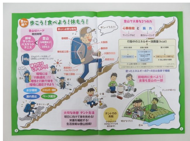
【生徒用のハンドブックの一例】