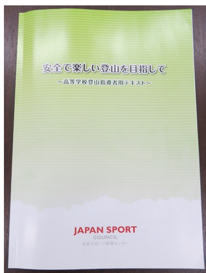
【高等学校登山指導者用のテキスト】

テキスト・ハンドブックはそれぞれ登山部・山岳部等のある高等学校等全国1,033校の他、各都道府県教育委員会、各都道府県山岳連盟等に順次配布いたします。また近日中に日本スポーツ振興センター国立登山研修所ホームページ( https://www.jpnsport.go.jp/tozanken/ )においても公開いたします。