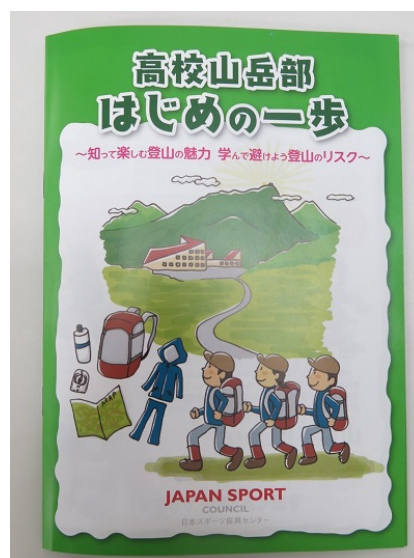
【生徒用のハンドブック】