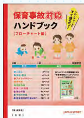
フローチャート編