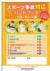
フローチャート編