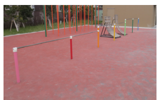
設置面の安全対策が行われた遊具の設置例