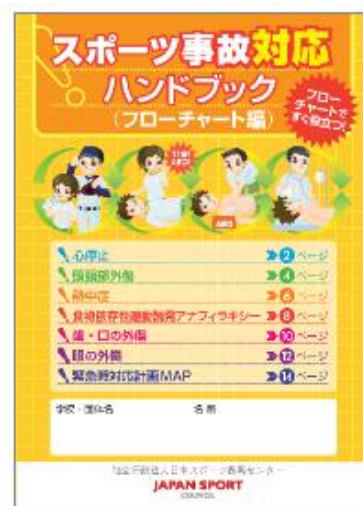
スポーツ事故対応ハンドブック