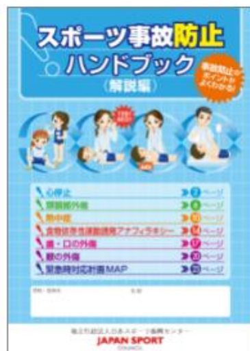
スポーツ事故防止ハンドブック

①「スポーツ事故防止ハンドブック（解説編）」には事故防止のためのポイントがまとめられており、②「スポーツ事故対応ハンドブック（フローチャート編）」には事故発生時の対応がフローチャートでまとめられています。どちらも携帯できるコンパクトなサイズに最新のデータと各有識者の知見が盛り込まれており、運動会や修学旅行の際などに救急セットの中に入れておくのにも便利です。