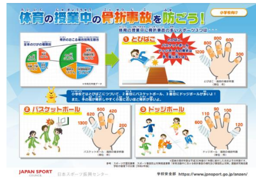
学校安全教材カード

季節やターゲットに応じた実用的なテーマで事故防止のための情報を見童生徒への指導教材に、教室や廊下などの掲示用に簡単で使いやすい、すぐにわかる（A4判、表裏）内容になっています。学校安全 Web に掲載しており、無料でダウンロードできます。