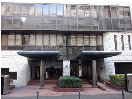
〔福岡県歯科医師会館〕

大会は、令和5年11月18日（土）、福岡県歯科医師会館5階大ホールで行われ、JSCは、「学校等での事故を減らすために」と題して、福岡県の災害の状況や歯の災害の状況と事例、災害共済給付Webのご紹介などをさせていただきました。