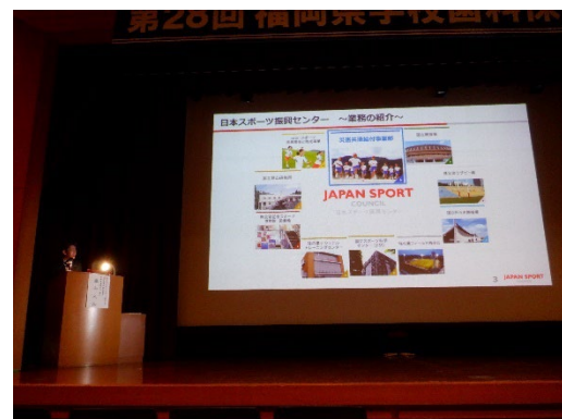
〔日本スポーツ振興センターの基調講演〕