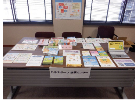
〔日本スポーツ振興センター展示ブース〕