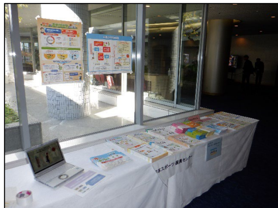
〈J S C 展示ブース 2〉