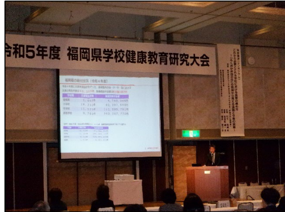
〈JSCの研究発表の様子〉

大会は、令和5年11月20日（月）、福岡リーセントホテル舞鶴の間で行われ、JSCは、「学校等での事故を減らすために」と題して、福岡県の災害共済給付の状況や災害共済給付Webのご紹介などをさせていただきました。