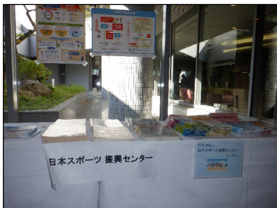
〈J S C 展示ブース 1〉

大会に参加されていない学校の先生方も、災害共済給付W e b をご覧いただき、気になる資料があれば、福岡支所までお問い合わせください。