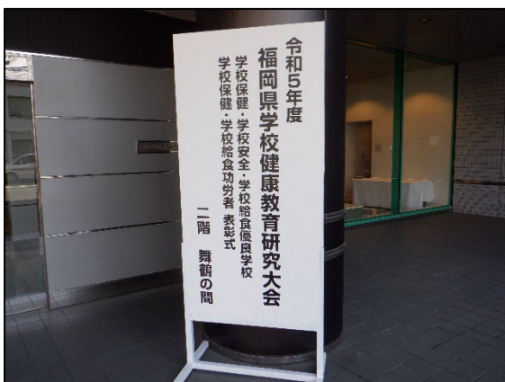
〈福岡県学校健康教育研究大会〉

JSCも毎年、福岡県教育委員会からの依頼を受け、学校等の事故防止に関する資料の提供などの機会をいただいているところです。