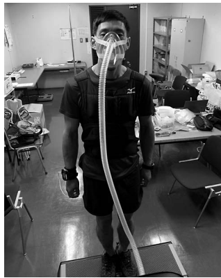
写真4) トレッドミルでの低酸素トレーニングの様子（負荷10kg）

ニングで学んだことを実践したことで軽い高度障害（身体がだるい、目の奥の痛みなど）はあったが、酷い頭痛がする、嘔吐する、意識が朦朧とするなどの重度障害は経験せずに安全に登山を終えることができた。