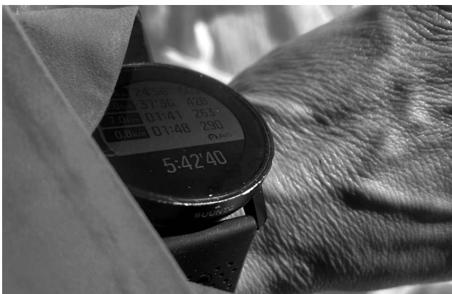
写真2) アマダブラム頂上にてタイムをチェックする

トレイルランニングの世界では当たり前のように利用されているスマートウォッチを普段のランニングからアルパインクライミングにまで持っていく、記録用としてデータを取っている。ペース、標高、距離そして心拍数すら行動しながら確認できとても便利だ。記録に挑戦している時に途中でペースを見ることは重要で、速すぎればペースを落とした方が良く、トレイルやルートコンディションがよいにも関わらずペースが遅いのであれば自身のコンディションが悪いというサインにもなる。自分の心地よいペース配分を理解する上でも有効だ。また私は「STRAVA」というアプリを使用しているが、それにはセグメント機能（GPS上である区間を分割すること）があり過去に同じトレイルを走った者のタイムと自分のタイムを比較することもできる。自身のタイム指標にもなり、前走者よりも早いタイムを狙うといった明確な目標を簡単に持たせてくれる。