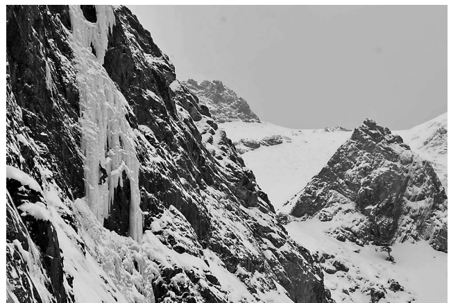
写真1) カナダ・R&Dエリアにてフリーソロアイスクライミング

以上のようなタイムを意識した、あらゆる地形でのソロクライミングの経験が今回のスピード登山には必要不可欠であった。それに加えて、どんな状況においても一人で山に入ることに、ソロクライミングに対してストレスを感じないようにトレーニングをすることも重要で、本番でのメンタルトレーニングにも繋がった。