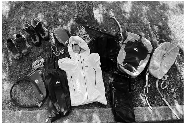
写真3) 実際に(4)-②でのトレーニングで使用したギア

イで新雪も無かったため、上部の氷河はクライミング用のアプローチシューズに無理矢理アイゼンを装着して登った。それによりブーツの重みも減らせ、履き替える時間も短縮できた。ロープを使用するかも重要で、使わなければハーネスも重たいクライミングギアも必要ない。したがってロープ使用はできるだけ避けたい。フリーソロで登りダウンクライムが出来ればロープは要らない。この点でもソロクライミングのスキルが必要になる。スピードクライミングの肝はフリーソロである。