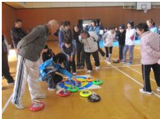
写真 (クラブの活動風景)