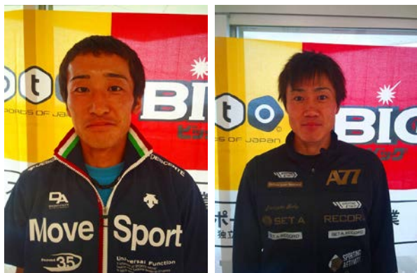
写真 (左：クラマネ 右：アシマネ)