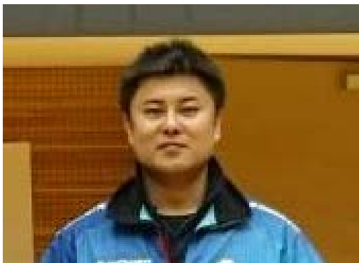
写真（クラブマネジャー）