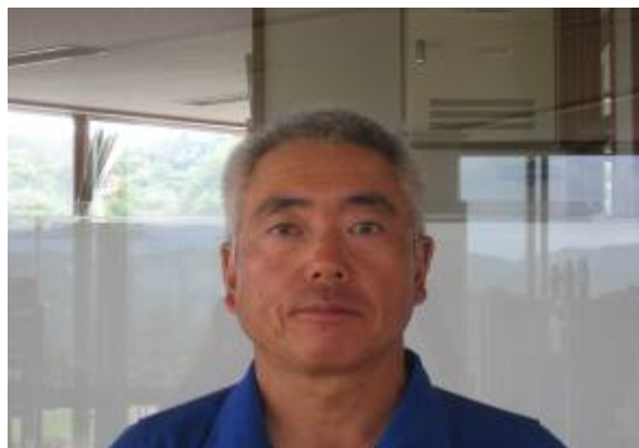
写真（クラブマネジャー）