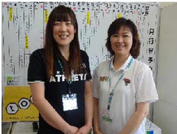
副マネジャー 正マネジャー