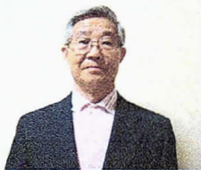
クラブマネージャー正