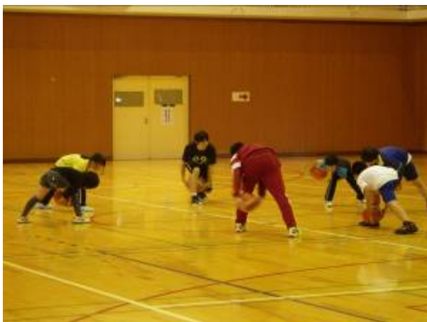
写真（クラブの活動風景）