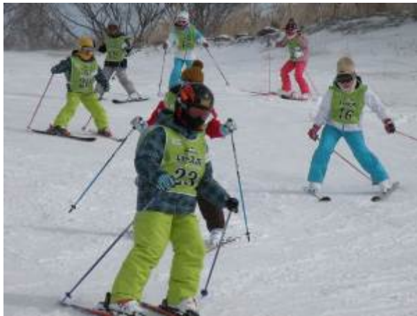
写真 (クラブの活動風景)