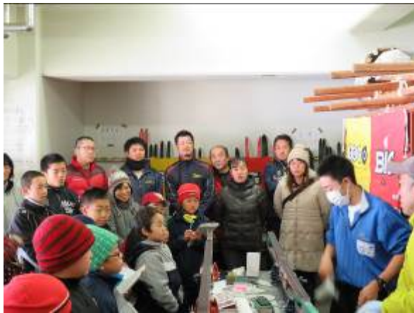
写真（クラブの活動風景）