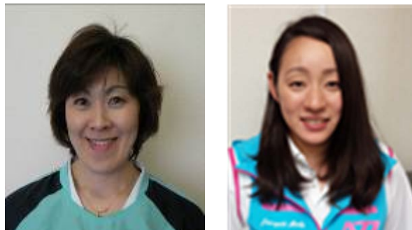
クラブマネジャー(正) クラブマネジャー(副)