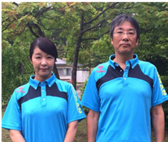
副マネジャー 正マネジャー