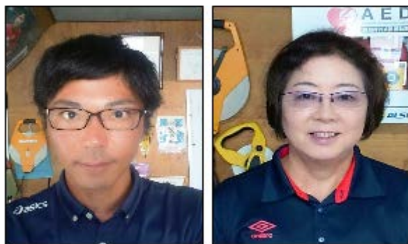
クラブマネジャー正