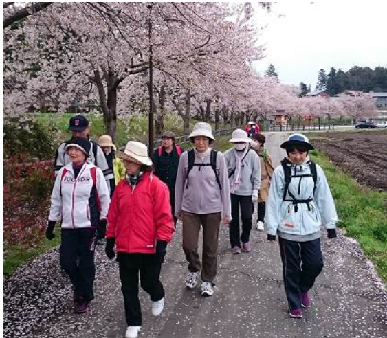
写真（クラブの活動風景）