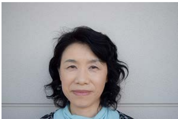
写真（クラブマネジャー）