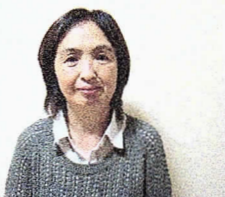
クラブマネージャー副