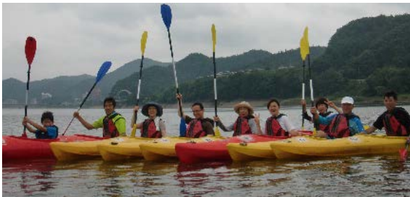
写真（クラブの活動風景）