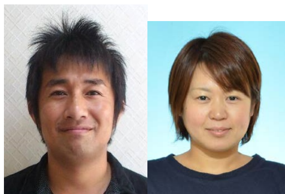
クラブマネジャー正 クラブマネジャー副

地元で活動されている先生方とクラブのクラスやイベントの企画～準備～実施に取り組んでいます。また教育委員会と連携して被災地域小学校を対象としたスポーツ&レク企画～講師派遣や、社会福祉協議会と連携した高齢者を対象とした軽スポーツや各種交流会も実施。地域のPTAレクや地区子ども会の派遣なども承っております。クラブ理念「笑顔をつなぐ」を掲げ地域のスポーツ推進&健康推進の活動に取り組んでいます。