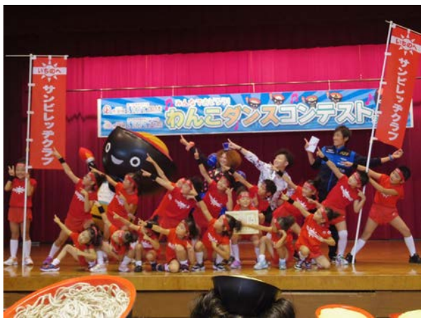
写真 (クラブの活動風景)