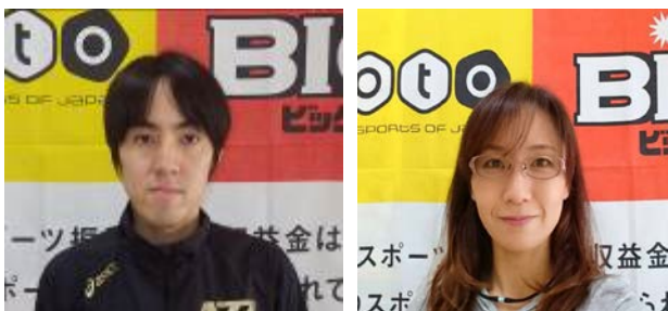
クラブマネジャー（正）