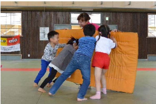
写真（クラブの活動風景）