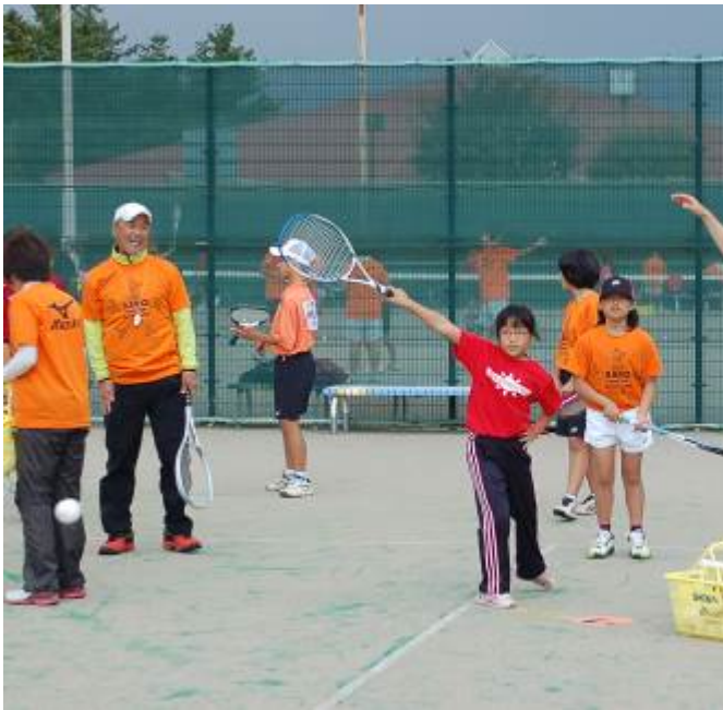
写真 (クラブの活動風景)