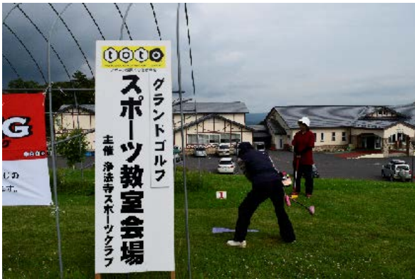
写真（クラブの活動風景）