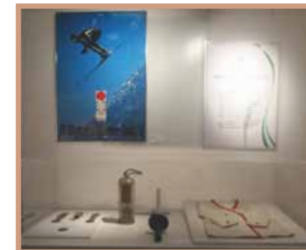
展示：1972年第11回札幌冬季大会