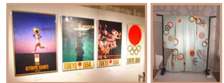
展示：1964年第18回東京大会(左・ポスター、右・着物)