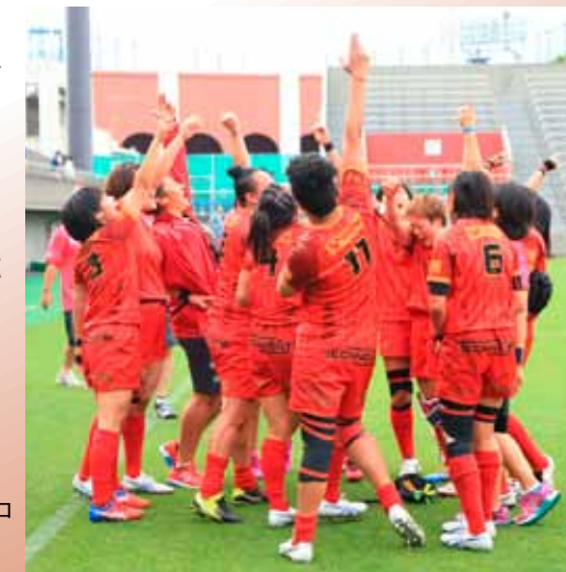
2016年リオデジャネイロオリンピックを目指して！

2016年リオデジャネイロオリンピックの正式競技として採用され、注目を浴びている7人制ラグビーですが、本大会出場をかけたアジア予選が今年の11月に開催されます。11月28日、29日には、秩父宮ラグビー場でアジア予選（女子）が行われます。アジアの出場はたったの1枠。リオの切符を手に入れるため、ぜひ皆さんで応援しましょう！