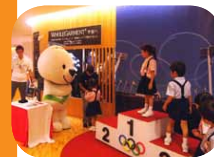
「メダリスト体験」コーナー

今後は、来年の1月23日(土)～3月13日(日)まで宮城県の東北歴史博物館で巡回展を開催する予定となっていますので、お近くの方はぜひご来場ください。