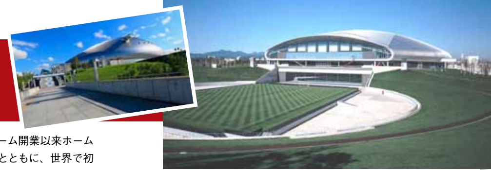
事前の協議を重ねることでお互いの要望を可能な限り実現しようと協力している。

所在地：〒062-0045 北海道札幌市豊平区羊ヶ丘1番地 ※レポートは平成25年度時点での内容となります。