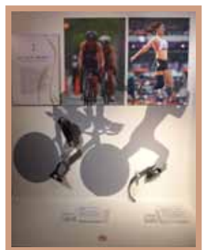
展示：パラリンピアン(義足)