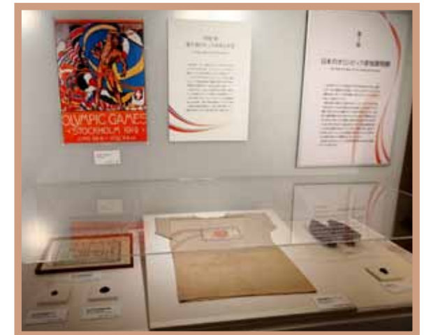
展示：1912年第5回ストックホルム大会