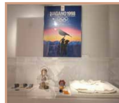
展示：1998年第18回長野冬季大会