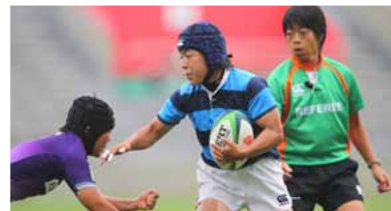
選手だけではなく、レフリーも女性が活躍

本大会では、レフリー11名のうち、女性4名が活躍しました。その中には、ママさんレフリーの姿も見られ、積極的に活動を行っています。ラグビーの場合、レフリーは大会経験と認定試験を重ね、トップレフリーを目指します。そして新たに公益財団法人日本ラグビーフットボール協会では、レフリーの人材発掘、技術や知識の習得を目指し、世界で通用するトップレフリーを育成するため、レフリーアカデミー制度を導入しました。本大会の女子レフリーのうち2名のレフリーがこのアカデミー生であり、国内だけでなく海外の大会でも活躍しています。現在、女子レフリーは全国に約30名ほどいて、それぞれの目標を持って活躍しています。