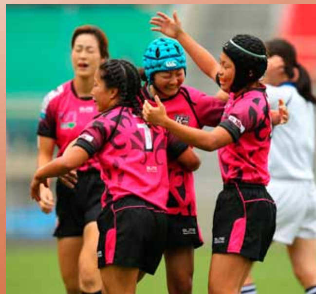
オリンピックでも見たい風景

ラグビー強豪国だけでなく、様々なラグビー発展途上国への地道な普及活動が続けられ、試合時間の短さがオリンピックの運営に合致したこともあり、2016年リオデジャネイロオリンピックの正式競技として採用されることが決まりました。2020年東京オリンピックでも開催が決定しており、日本チームのますますの活躍が期待されます。