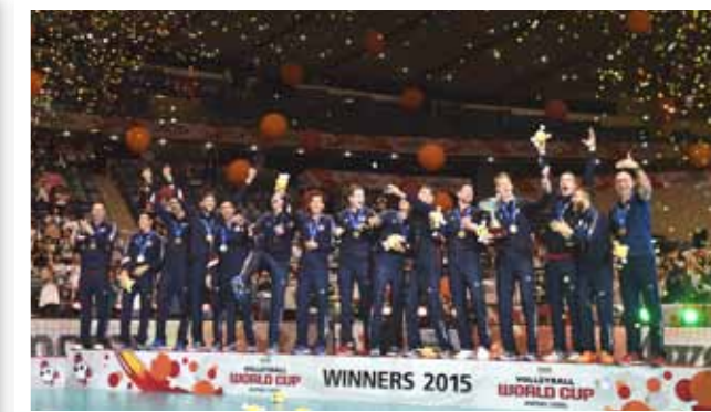
▲優勝した男子アメリカチーム