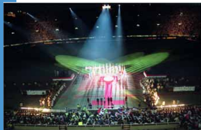
平成5年5月15日 Jリーグ開幕セレモニー