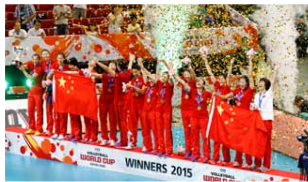
▲優勝した女子中国チーム

バレーボールのビックイベントのひとつ「FIVBワールドカップバレーボール2015男女大会」が、8月22日に開幕しました。開幕の場となった国立代々木競技場第一体育館は、ワールドカップや数々のバレーボールの大会で名勝負が繰り広げられた舞台として、バレーボールの「聖地」と呼ばれています。ワールドカップは、国際バレーボール連盟が主催するオリンピック、世界選手権と並ぶ公式大会として4年に一度開催され、1977年から男女大会とも日本で開催しています。これまでバレーボールのイベントは「秋」というイメージがありましたが、今